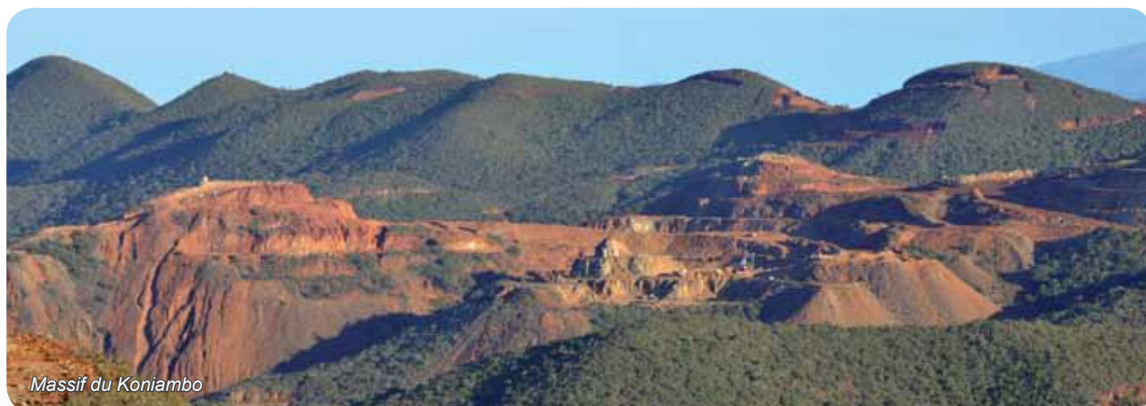
Massif du Koniambo

La production de ferronickel s'effectue par l'utilisation d'un procédé pyrométallurgique classique avec une technologie nouvelle développée par les unités de recherche et de développement de Falconbridge. Le procédé « technologie de fusion du nickel » (Nickel Smelting Technology) utilise un équipement à technologie moderne, éprouvé à grande échelle dans d'autres industries lourdes. Sa conception vise spécifiquement à confiner les poussières, permettant ainsi un rendement environnemental de pointe. Le procédé s'inspire fortement de l'industrie du ciment qui a introduit au cours des dernières années le recyclage et la réutilisation des gaz de traitement pour économiser l'énergie.