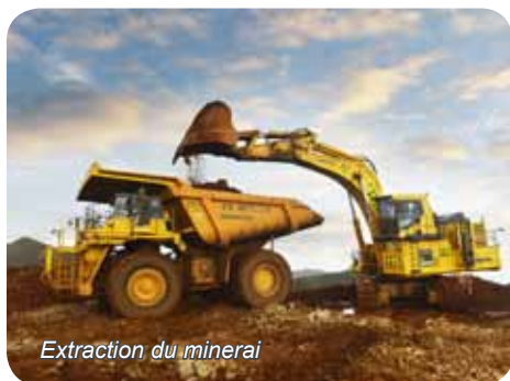
Extraction du minerai