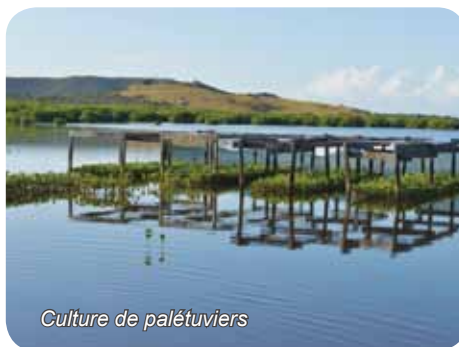
Culture de palétuviers