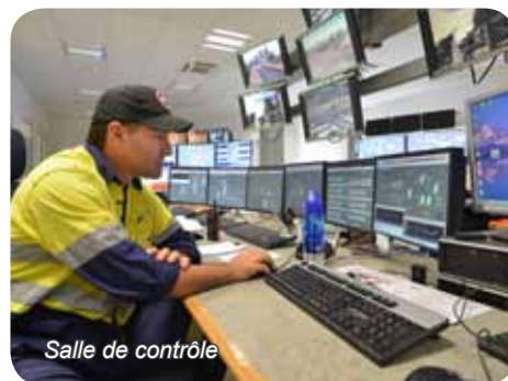
Salle de contrôle